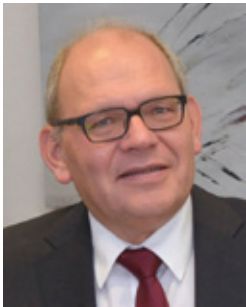
Ulrich Knickrehm Bürgermeister

Herzliche Grüße und einen angenehmen Aufenthalt wünschen Ihnen