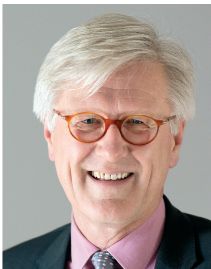
Reinhard Kardinal Marx Vorsitzender der Deutschen Bischofskonferenz